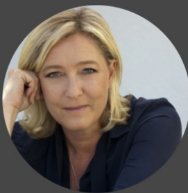
Marine Le Pen