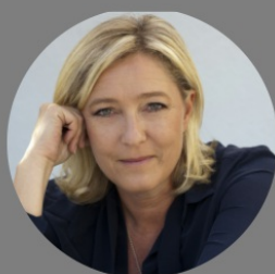
Marine Le Pen