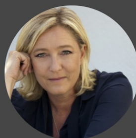
Marine Le Pen