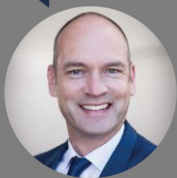
Gert-Jan Segers CU