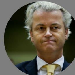
Geert Wilders PVV