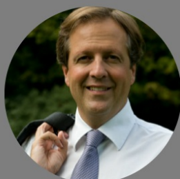
Alexander Pechtold D66