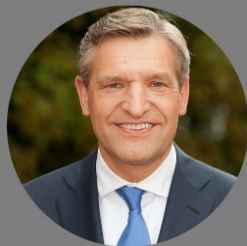
Sybrand van Haersma Buma CDA