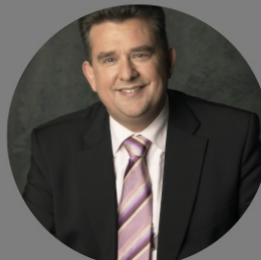
Emile Roemer SP