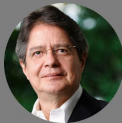
Guillermo Lasso CREO - SUMA