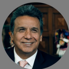
Lenín Moreno ALIANZA PAÍS